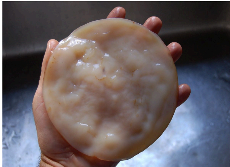
Imagen 1. Características fenotípicas de un cultivo simbiótico saludable (SCOBY).

Muestra representativa de un consorcio microbiano sano. Se observa una consistencia firme, superficie lisa y una coloración parda uniforme, indicativos de una actividad metabólica saludable y ausencia de contaminantes fúngicos externos.