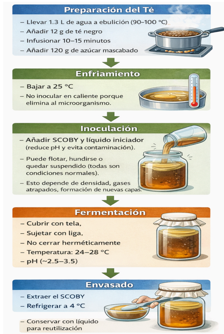
Figura 7. Proceso de fermentación de la kombucha

Descripción secuencial de las etapas de infusión, enfriamiento controlado para preservar viabilidad microbiana, inoculación, y parámetros operativos (temperatura, pH) requeridos para la bioconversión aeróbica de azúcares y polifenoles por el consorcio simbiótico SCOBY.