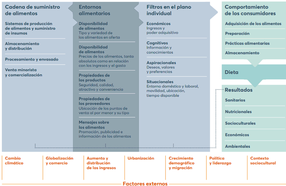
Figura 1: Marco de los sistemas alimentarios