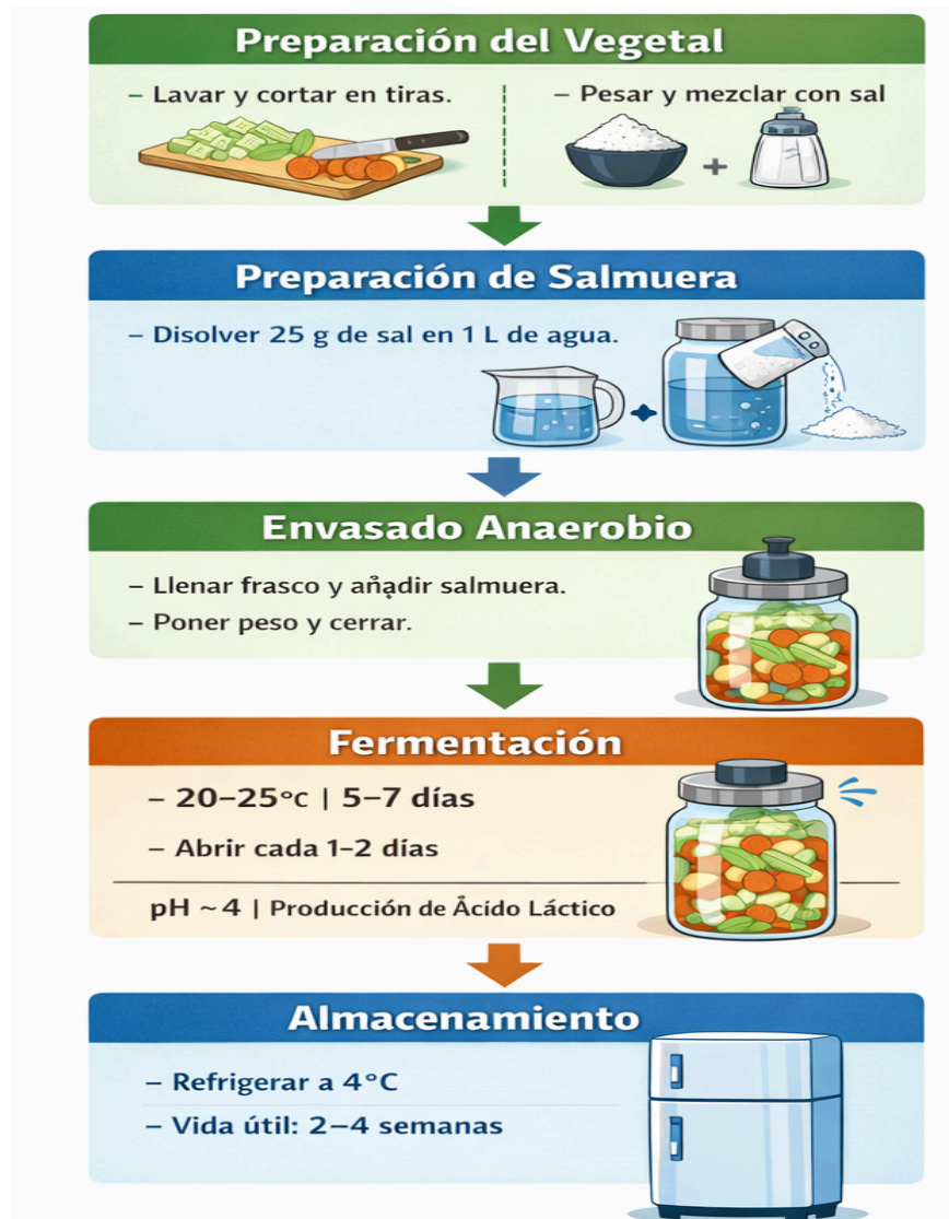
Figura 4. Proceso de fermentación de vegetales

Proceso de fermentación de vegetales mediante salmuera, desde la preparación hasta el almacenamiento, destacando condiciones de anaerobiosis, temperatura y producción de ácido láctico.