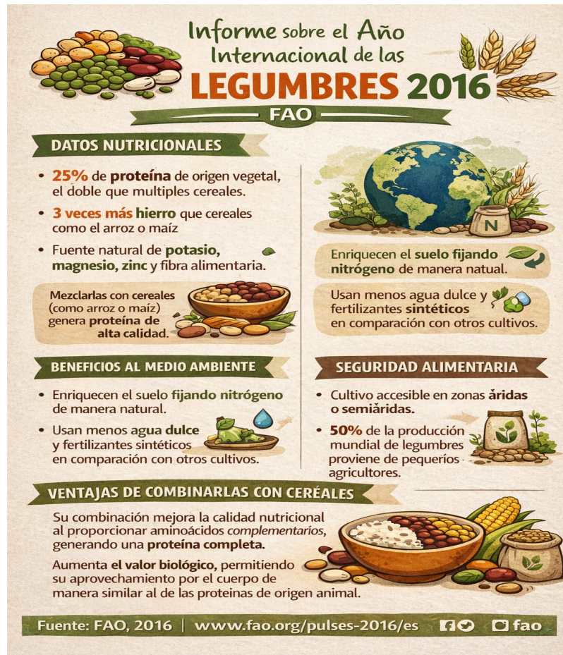
Figura 2. Importancia nutricional y ambiental de las leguminosas en la alimentación basada en plantas