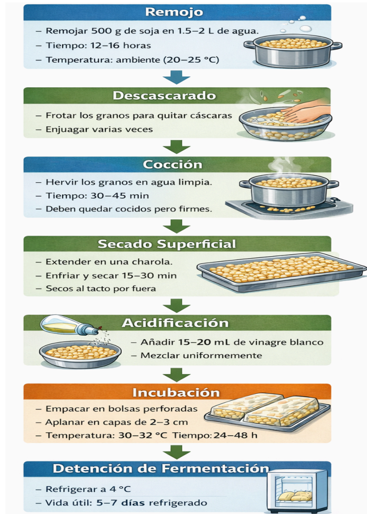
Figura 6. Proceso de fermentación del Tempeh

Descripción detallada de las etapas de acondicionamiento de la soja ( Glycine max ), incluyendo parámetros críticos de acidificación (pH) e incubación (30–32 °C) durante un periodo de 24–48 horas para asegurar la fermentación fúngica óptima.