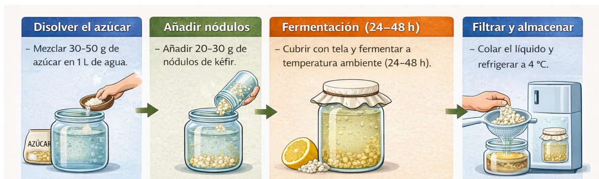
Figura 8. Proceso de fermentación de Kéfir

Etapas de preparación del sustrato glucosado, inoculación con nódulos de kéfir (20-30 g/L) y el periodo de incubación a temperatura ambiente. Se resalta la fase de separación de la biomasa mediante filtración y la posterior estabilización térmica del producto final a 4 °C para ralentizar la actividad metabólica residual.