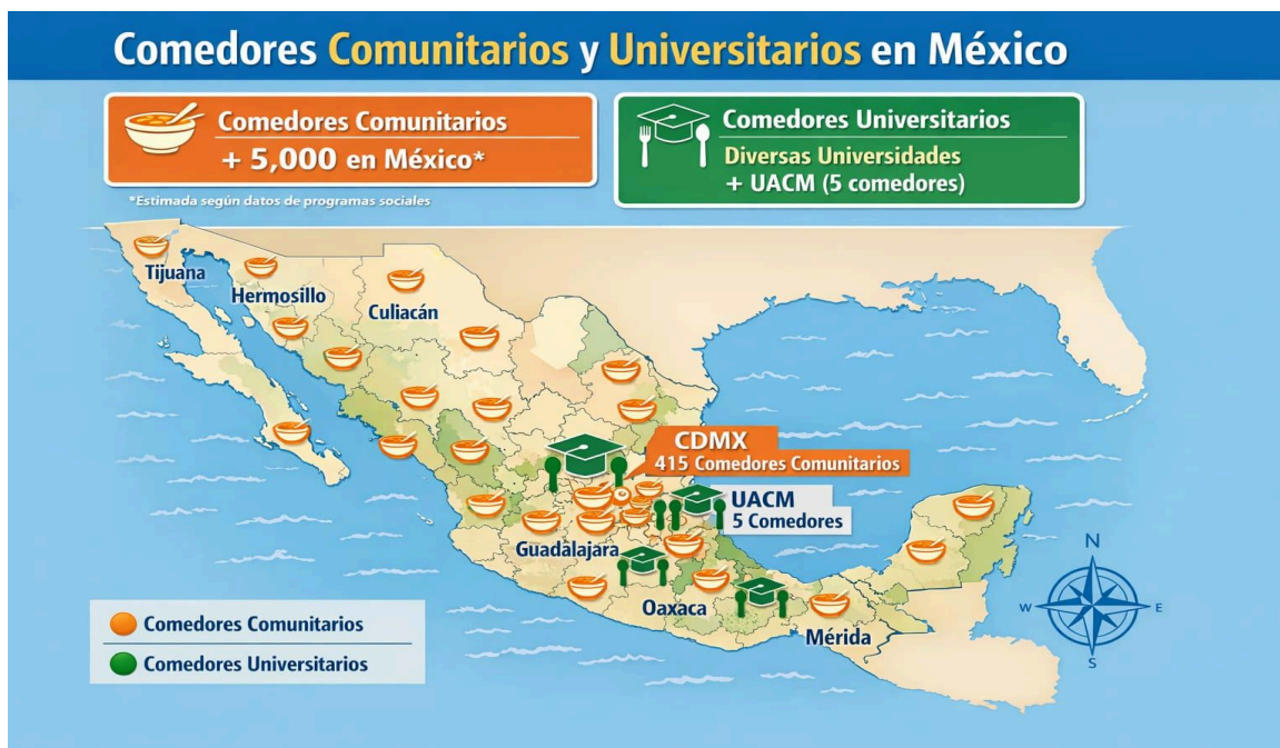
Figura 3. Comedores comunitarios y universitarios en México

Distribución general de comedores comunitarios y universitarios en México, elaborada con fines académicos a partir de información pública de programas de bienestar y educación superior, como referencia para el análisis del sistema alimentario institucional y su potencial transición hacia modelos más sostenibles.