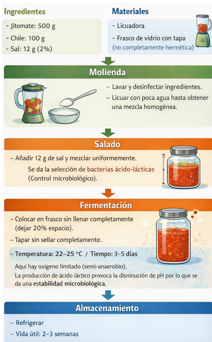
Figura 4. Proceso de salsas fermentadas

Proceso de fermentación de salsa vegetal mediante fermentación ácido-láctica en condiciones semi-anaerobias, donde la adición de sal ( \approx 2\% ) favorece el crecimiento de bacterias benéficas y la producción de ácido láctico, provocando la disminución del pH y la estabilización microbiológica del producto.